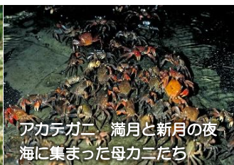
アカテガニ 満月と新月の夜 海に集まった母カニたち