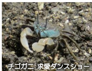
チゴガニ 求愛ダンスショー