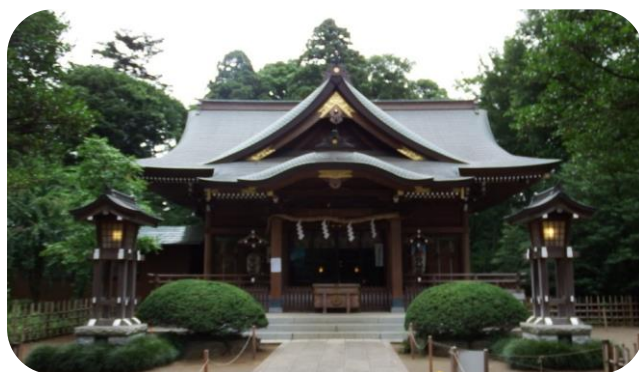
柏市総鎮守「廣幡八幡宮」