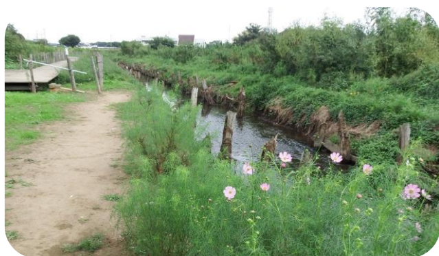
白幡橋付近「大津川緑道」