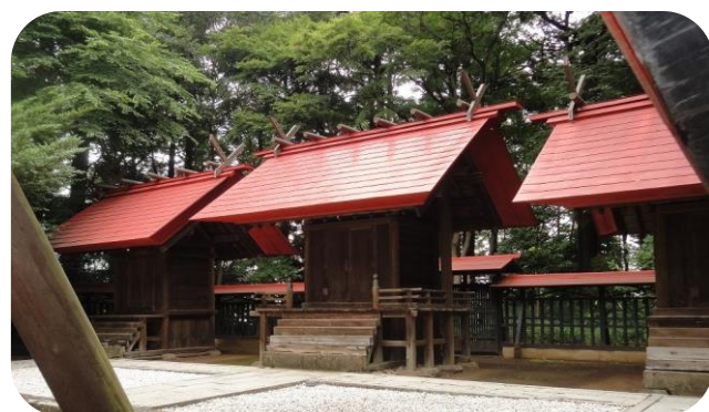
「神明社・沼南の森」