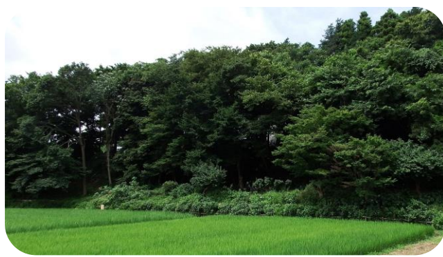
カシニワ「かにうちの森」